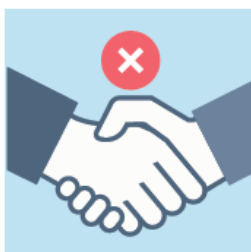
JE NE SERRE PAS LA MAIN POUR LE GESTE DE PAIX (JE PEUX FAIRE UN AUTRE SIGNE À DISTANCE)