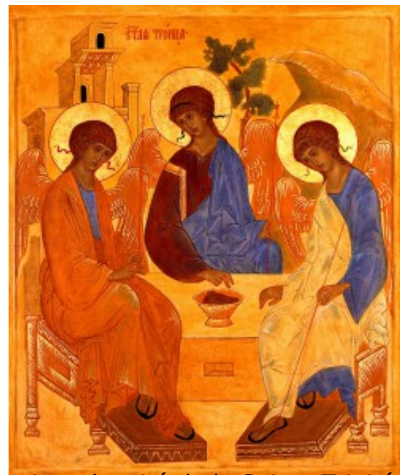
La solennité de la Sainte Trinité janvier 1997: Art Sacré, copie avec variante de l'icône de la sainte Trinité de Andreï Roublev.

Les fidèles doivent se rappeler que la liturgie de la Jérusalem céleste, à laquelle participe réellement la liturgie d'ici-bas, est l'insertion parfaite de l'Église, Épouse et Corps du Christ, dans la vie du Fils, engendré par le Père dans l'Esprit Saint, et refluant vers le Père dans le même Esprit Saint.