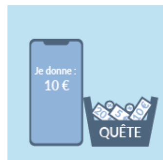
JE PARTICIPE À LA QUÊTE EN SORTANT OU EN LIGNE SUR APPLI-LAQUETE.FR OU QUETE.CATHOLIQUE.FR