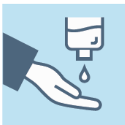
JE FROTTE MES MAINS AVEC LE GEL HYDROALCOOLIQUE DISPONIBLE À L'ENTRÉE