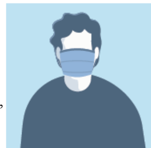
JE PORTE UN MASQUE